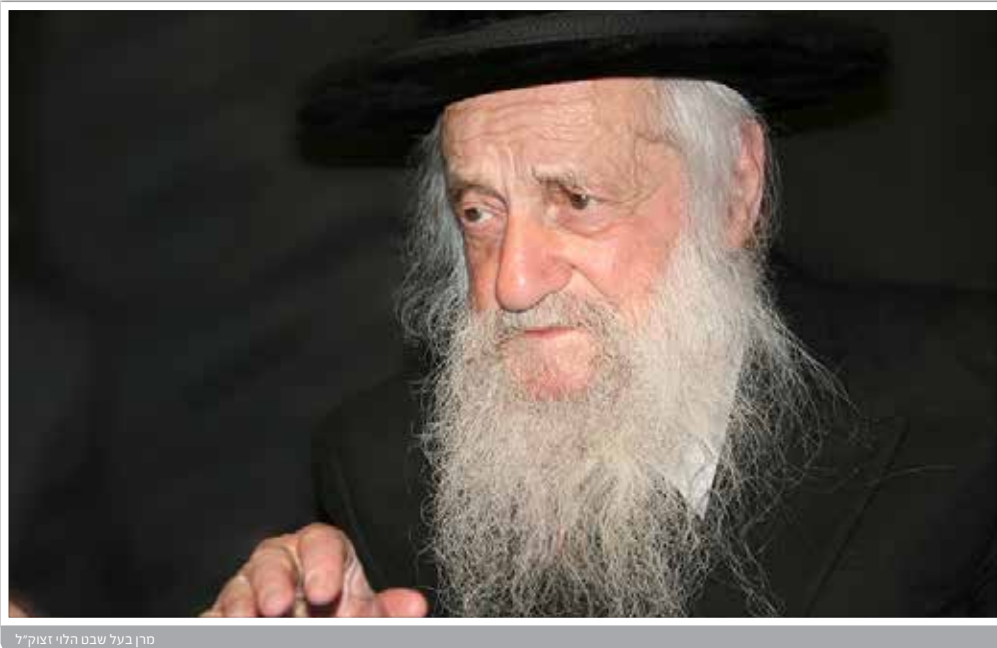
מרן בעל שבט הלוי זצוק"ל