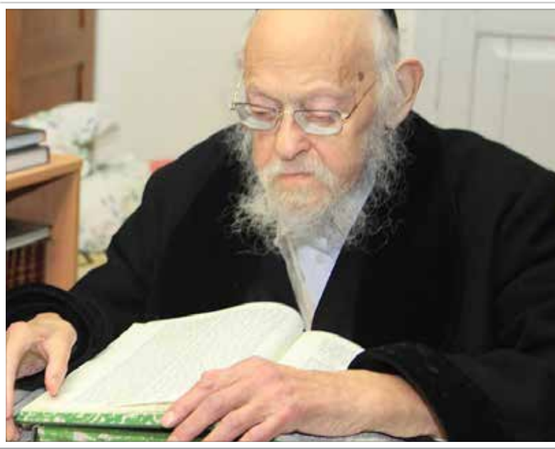
מרן הגרי"ש אלישיב זצ"ל

יכולני לספר עוד על הנהגתו המופלאה של מו"ח בענייני הכספים, שהרי, הרבנית עצמה לא עבדה במשרה כלשהי; את מְשֻׁקְתָּה היחידה