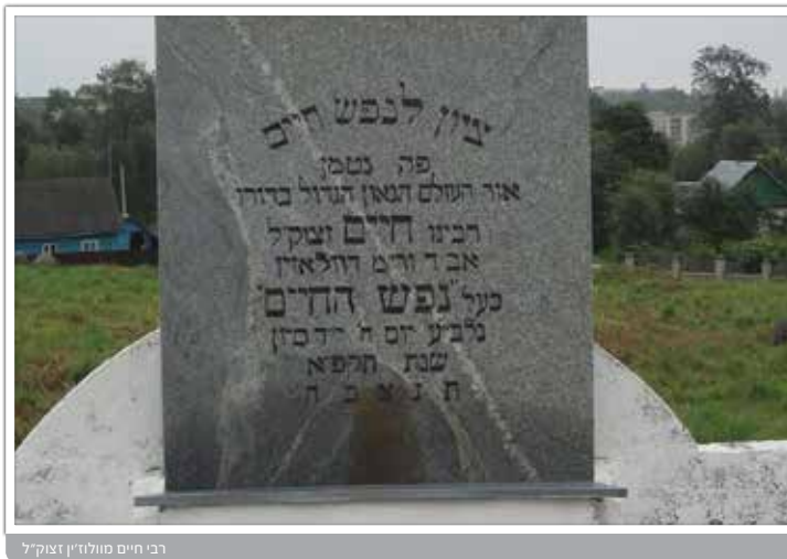
רבי חיים מוולוז'ין זצוק"ל

מששבה לוולוז'ין שאלה הרבנית את בעלה: "כיצד ידעת שהאשה תסכים לשידוך, לאחר שרק לפני תקופה קצרה כה התנגדה לו? האם קבלת איזושהי ידיעה על כך שהיא שינתה את דעתה?" נענה רבי חיים ואמר לה: "לא היתה לי כל ידיעה על כך שהיא מסכימה לשידוך. אלא שהתנא באבות (ב, ד) אומה: 'בטל רצונך מפני רצונו, כדי שיבטל רצון אחרים מפני רצונך', אני, אמנם, רציתי את השידוך אבל משראיתי את התנגדותה הנחרצת של האמא, הבנתי שאין הפשט שהיא לא רוצה את השידוך, אלא שהקב"ה לא רוצה בו. בטלתי, אפוא, את רצוני